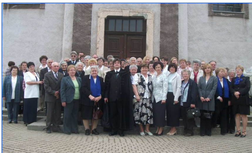
A konfirmációs találkozó résztvevői