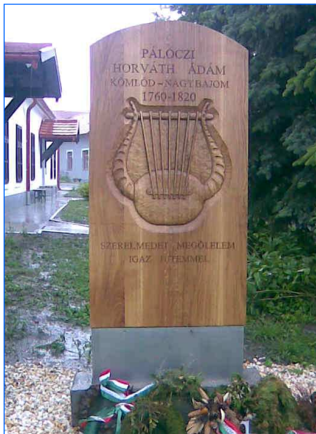
Emlékmű a szülői ház mellett

A nap programjában a következő helyszín a faluház épülete volt, ahol Pálóczi Horváth Ádám emlékének szentelt kiállítást rendeztünk be a Kömlődi Református Egyházközség és