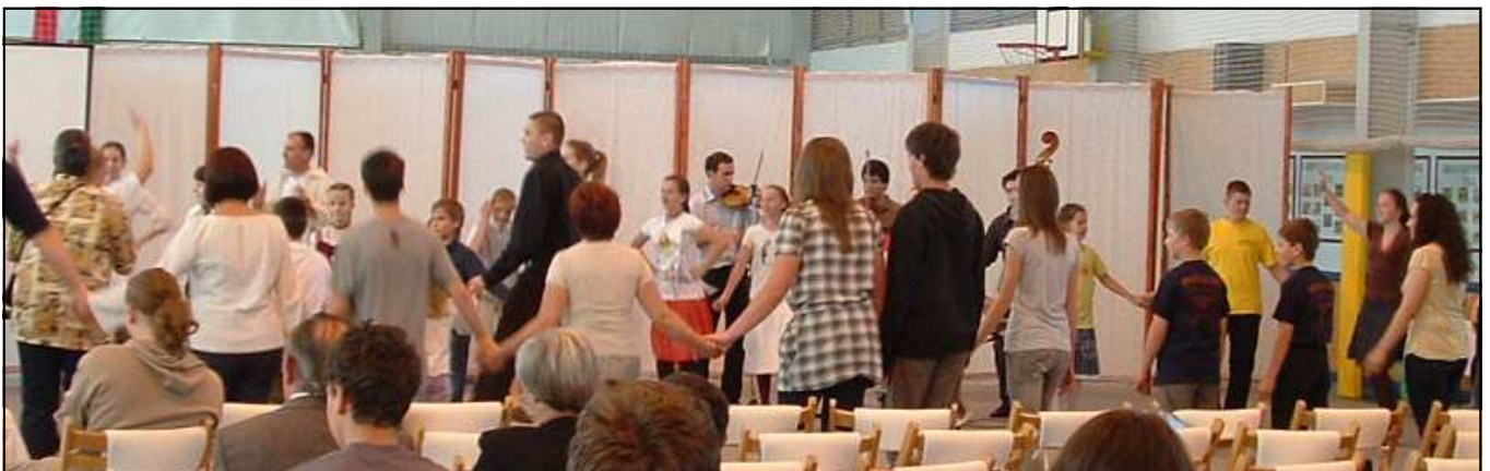
Táncház a konferencia résztvevői számára