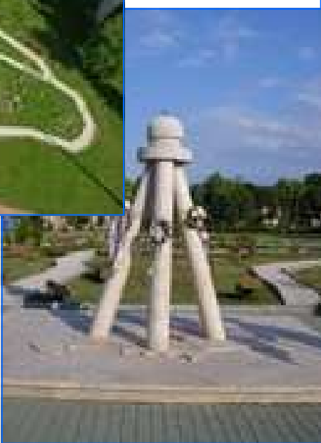
Trianon emlékpark és emlékmű Nagyigmándon

2009. május 22-én, a magyarországi, kárpátaljai, délvidéki, erdélyi és partiumi részegyházak Debrecenben aláírták a Magyar Református Egyház Alkotmányát. Ezzel a lépéssel, közel húszévi