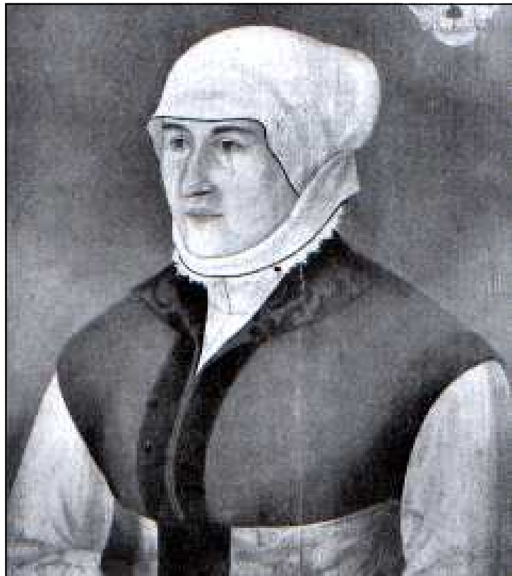
Lorántffy Zsuzsanna arcképe

Bizonyára kíváncsiak vagytok, hogyan folytatódott a története? A következő számban megtudjátok. De gondoljatok