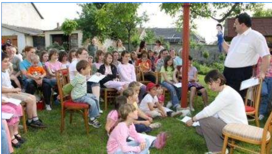
Hittanos tábor Ácson