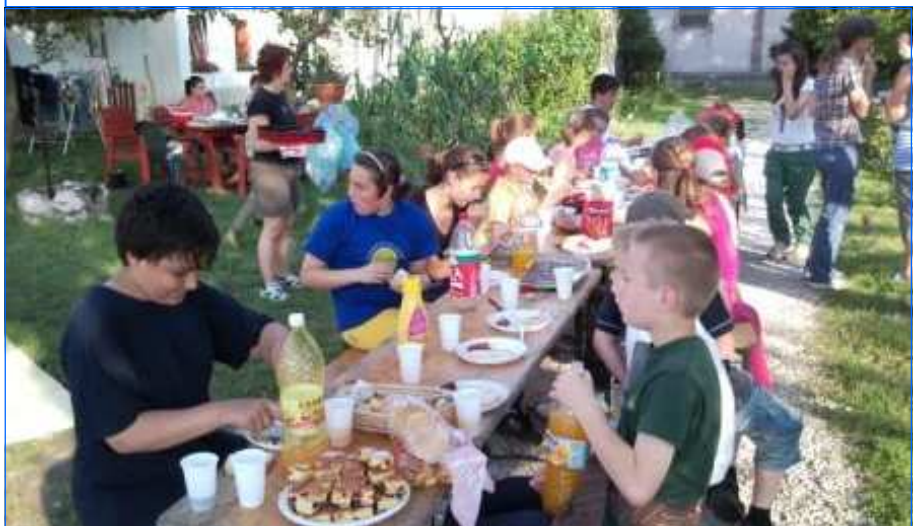
Nagyigmándi kerti parti

Hallod? Ördög bújta, Vigyáznod kell! Számadás jön, Közel a vég. Képmutató megbánásnak Értelme nincs. Kénkő folyik, Ahová mész. Intettelek-mentettelek, Ellökted a segítő kézt. Veled bíz én Nem mehetek. Várnak rám Az igaz szívek. Lelkem nekik Tovább adom. Ingyért kaptam, Könnyen adom