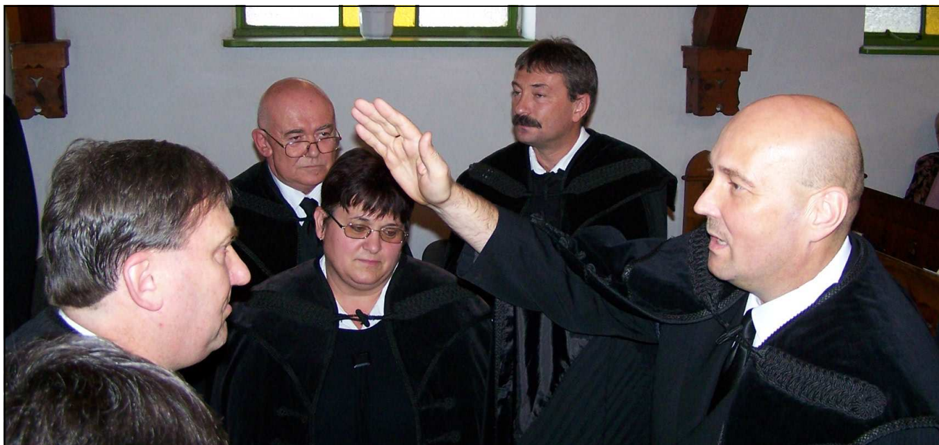
Főtiszteletű Steinbach József püspök áldása

2010. szeptember 19-én zsúfolásig megtelt a kishéri református templom. Ezen a napon iktatták be tisztségébe Vajs Tibor református lelkipásztort. A közel húsz éve Kisbéren szolgáló lelkész életének jelentős állomása érkezett most el. Megérett az idő, hogy beiktatott lelkészként szolgálhasson tovább. Isten Igéjét e napon főtiszteletű Steinbach József püspök hirdette.