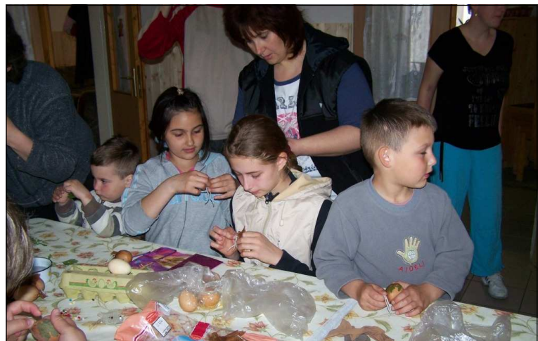
Nekünk is sikerült megcsinálni!