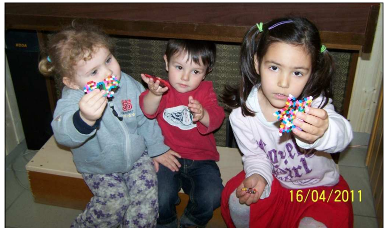
Látjátok? Mi ezt készítettük!