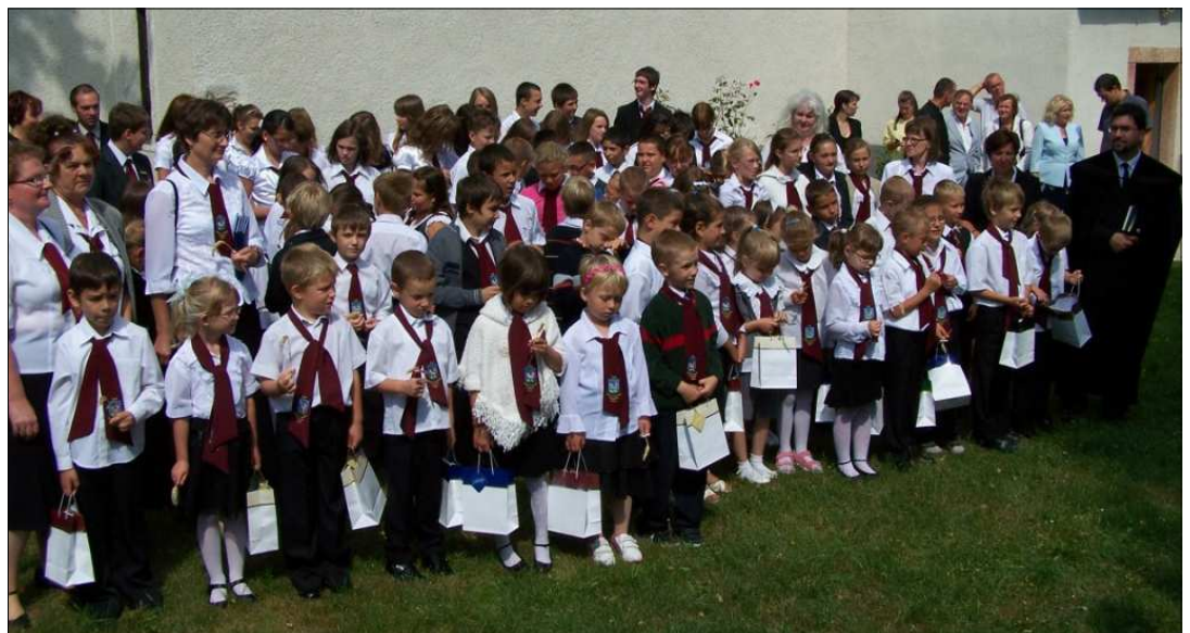
Augusztus 28-án az ünnepélyes tanévnnyitóval kezdetét vette a dadi református iskolában a 2011-2012-es tanév.