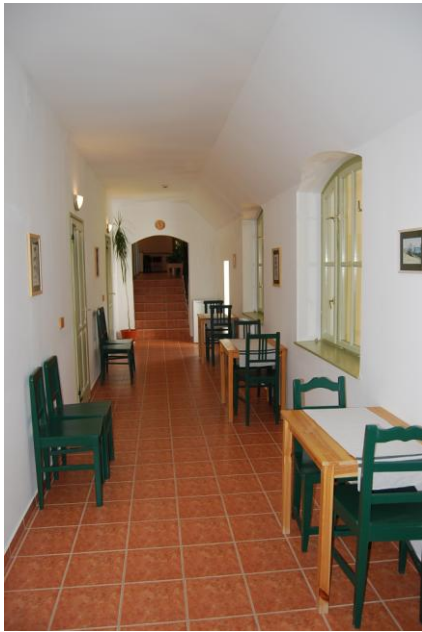
Folyosó 1. emelet