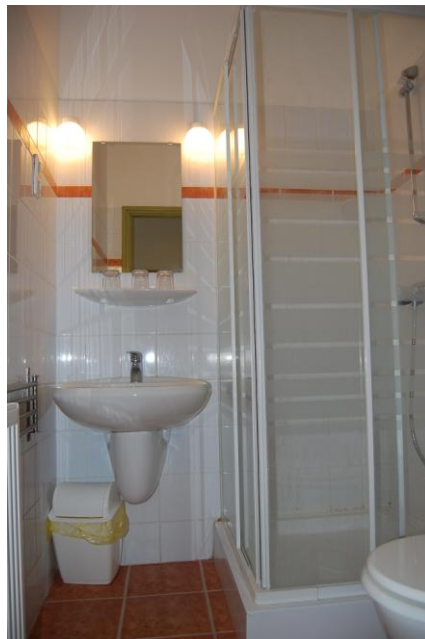
7. szoba zuhanyzó