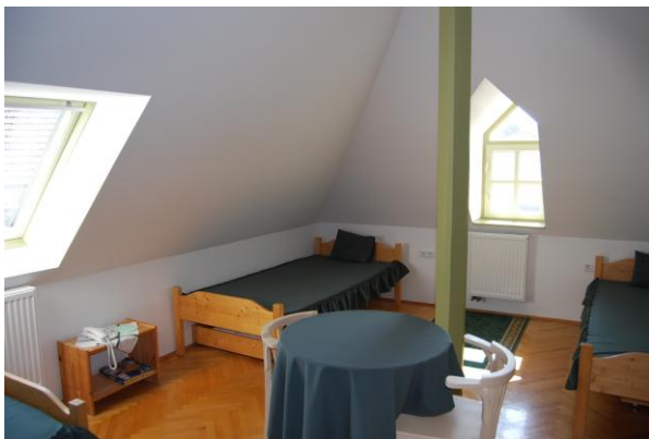
6. lakosztály belső szoba