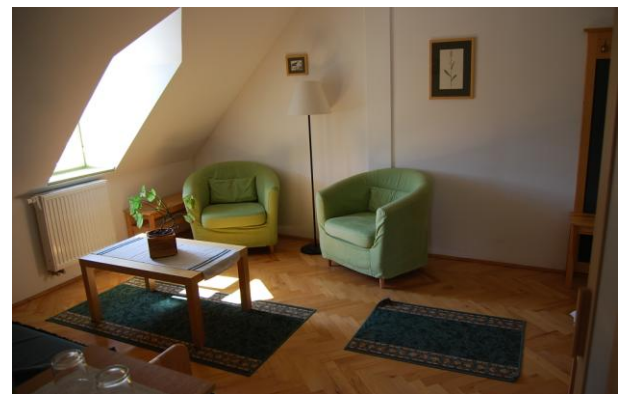
6. lakosztály külső szoba