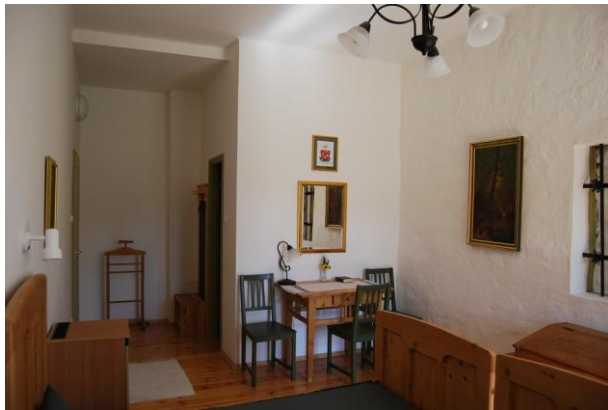
3. műemlék szoba