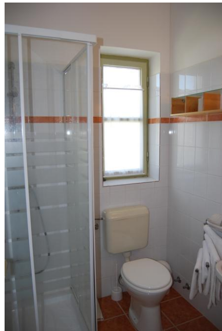
16. szoba zuhanyzó