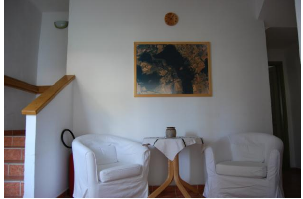
Társalgó 2. Földszint