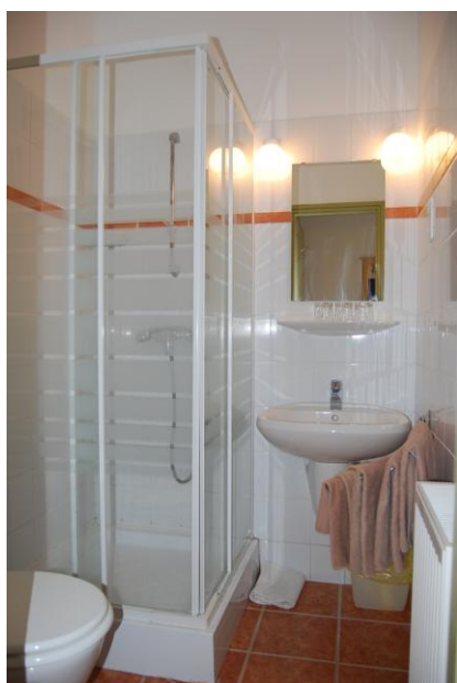
8. szoba zuhanyzó