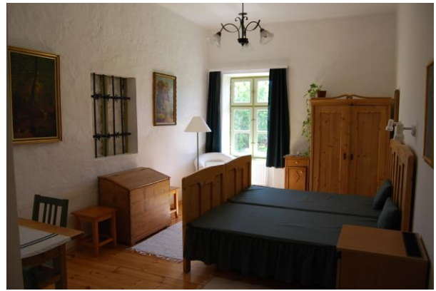
3. műemlék szoba