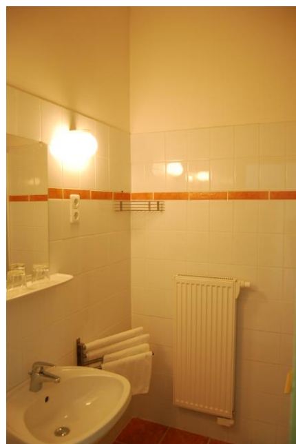
4. szoba zuhanyzó