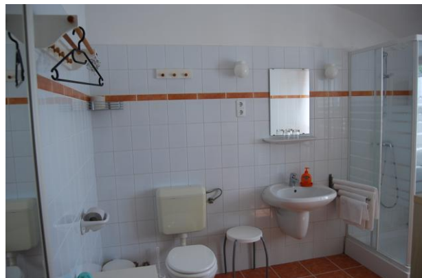
Püspöki lakosztály zuhanyzó