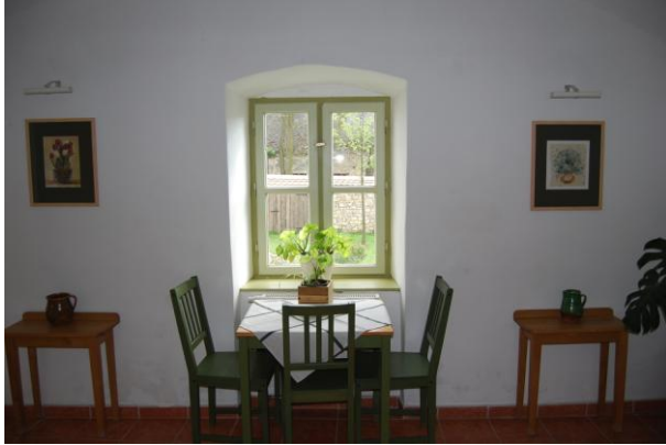
Társalgó 1. Földszint