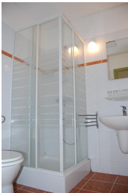
6. lakosztály zuhanyzó