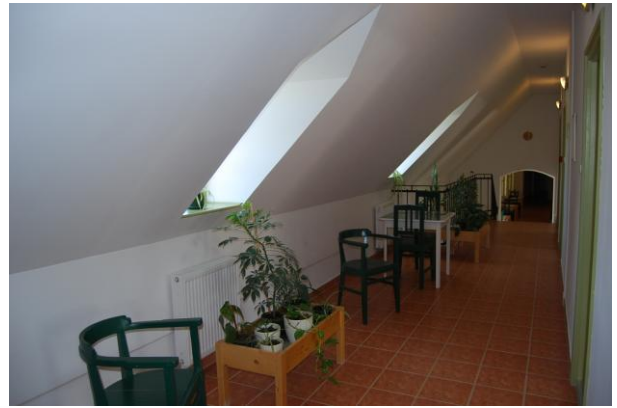
Folyosó 1. emelet