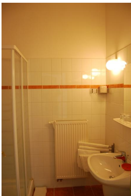
3. műemlék szoba zuhanyzó