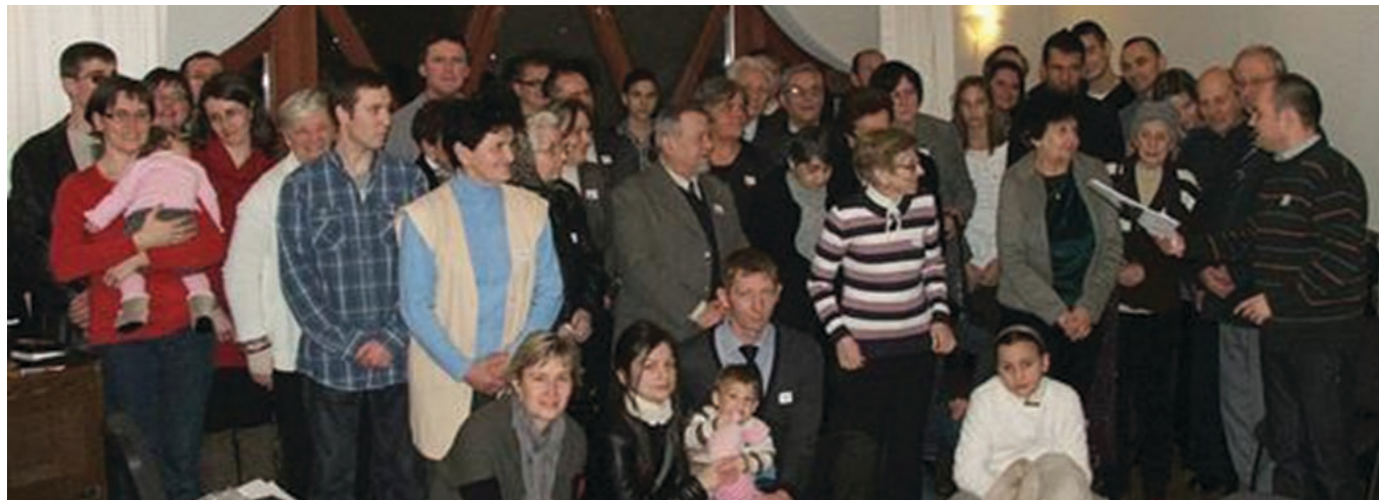
A Taksonyi Református Missziói Egyházközség tagjai 2014. február 2-án látogattak el gyülekezetünkbe.