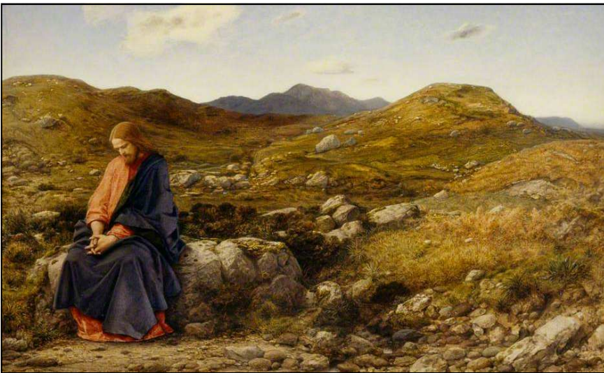
A pusztában böjtölő Jézus (William Dyce festménye, 1860 körül)

De azt is megismerjük az Márk tudó-sí-tá-sá-ból, hogy a kísértés-nek rendelt ideje van. A 40 nap meg-ha-tározott időszakot jelent. Egy meg-ha-tározott ideig volt Jézus a pusztában, és ad-dig volt ideje a kísértésnek. Ám az az idő le-telt. Eszünkbe jutnak Jakab apos-