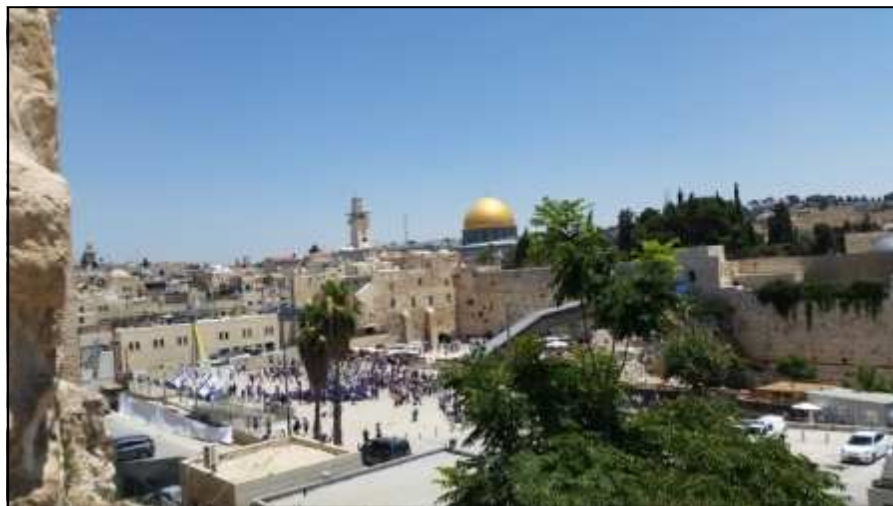
Az olajfák hegye

nek maradványaira építették a keresztény lovagok az 1149-ben felszentelt román stílusú Szent Sír-kápolnát. Azóta sok ezernyi zarándok járja végig súlyos fakereszttel a vállán a Megváltó utolsó útját, a Via Dolorosát. Jeruzsálem az iszlámnak is szent helye, ezt a nyolcszögletű Sziklamecset jelképezi, a korai iszlám építészet mesterműve. Természetesen a Jeruzsálembe látogatók nemcsak az építészeti látványosságokban és a vallási gyakorlatokban meríthetik ki az érdeklődésüket. Az Óváros