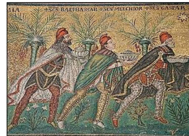
A három bölcset és a betlehemi csillag a ravennai San Apollinare Nuovo bazilika mozaikján (i. sz. 565)