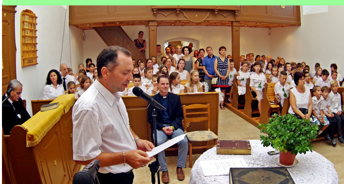
Képek: felújított iskola - óvoda udvar, és évnyitó