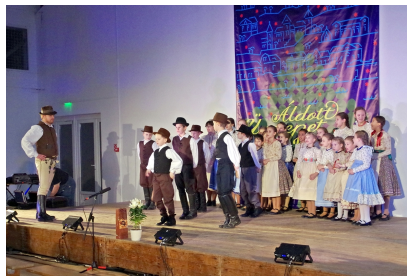
ISKOLAI KARÁCSONYI CSENDES NAP