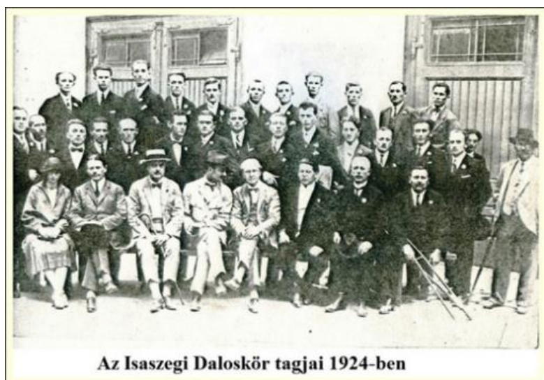
Az Isaszegi Daloskör tagjai 1924-ben

A szobor felavatása nagyszabású ünnepség keretében, Ferenc József császár és király jelenlétében, 1901. május 19-én került sor. Róna József szobrászművész alkotása, a világ első, egészalakos Erzsébet királyné-szobra. Kezében virággal és napernyővel – miként sétái alkalmával a gödöllői lakosok gyakran látták – örökíti meg személyiségét. A virágfüzérés kőtalapzaton álló, két és fél méter magas bronzszobor egyenes tartásával, arcának finom vonásaival, alakjának gondos kidolgozásával sokat elárul a királyné szépségéről, és a magyarok iránta érzett szeretetéről. A felavatás keretében Ripka Ferenc adta át a szobrot megőrzésre az ünnepi beszédet is mondó Darányi Ignác földművelésügyi miniszternek.