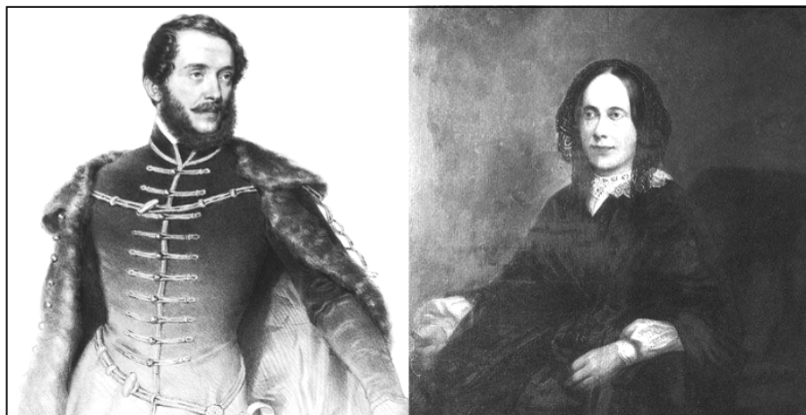
Kossuth Lajos és Meszlényi Terézia

Kossuth Lajos és felesége, ha képletesen is, de megfordult Dadon, mint keresztaszülő, de Kömlődön biztosan ott voltak a keresztelőkön.