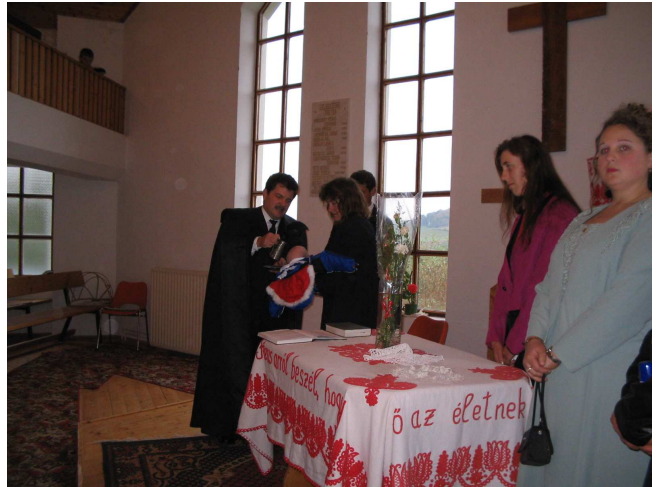
Az Atyának, a Fiúnak és a Szent Léleknek nevébe ...