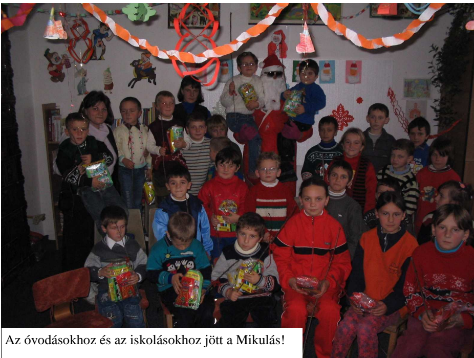
Az óvodásokhoz és az iskolásokhoz jött a Mikulás!

egy jót szólni * egy beteget felvidítani * valakinek kezet nyújtani * óvatosan csukni be az ajtót * apróságoknak örülni * mindenért hálásnak lenni * jó tanácsot adni * egy levél megírásával örömet szerezni * apró túlzásokon nem rágódni * jogos panaszt nem megígíteni fel újra * nem tenni szóvá, ha a másik hibázik * nem elutasításnak venni, ha a háttérbe szorulunk * levert hangulatot nem venni komolyan * nem sértődni meg egy fél-