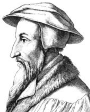
Kálvin János (1504-1564)

lom kapujára 95 tételét. Kálvin János, a tudós reformátor jelenik meg előttünk, amint szívét, életét Istennek szenteli élő hálaáldozatul, nem gondolva azzal, hogy ennek milyen következményei lehetnek.