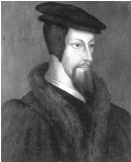
Kálvin János (1509-1564)

Ötszáz évvel ezelőtt született Kálvin János (1509-1564). Egyházunk a Kálvin Emlékevek ünnepségsorozattal emlékezik a reformáció svájci ágának szellemi atyjára, egyházközségünkben pedig előadás hangzott el életéről és munkásságáról. Cikkünkben a predestinációról, vagyis az eleve elrendelésről vallott, sok vitát kiváltó nézeteit tekintjük át a Biblia fényében.