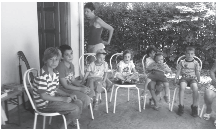
Gyülekezetünk táborozó gyermekei

Ötnapos bibliai foglalkozásra hívtuk a gyermekeket a Kassai téri játszótérre délelőttként augusztus 16-20-ig. Helye volt itt a játéknak, a nevetésnek, az éneklésnek, a bibliai történeteknek és a versenyeknek is, de fő célunk az volt, hogy Isten szeretetét vigyük el a kicsinyeknek.