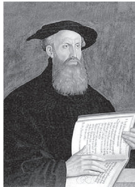
Bullinger Henrik (1504-1575), a Második Helvét Hitvallás szerzője

„Hisszük, hogy ennek a bölcs, örökkévaló és mindenható Istennek gondviselése tartja fenn és kormá-