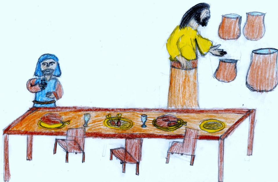
A kánai menyegző— Lakatos Fábian rajza