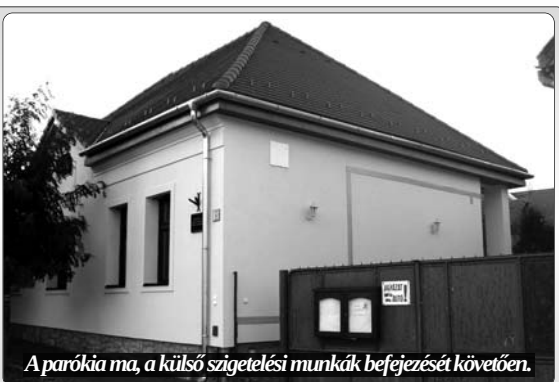
A parókia ma, a külső szigetelési munkák befejezését követően.

Gyülekezeti újságunk következő száma várhatóan december 24-én jelenik meg.