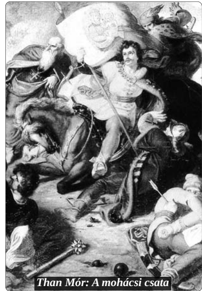
Than Mór: A mohácsi csata

Az utódoknak nem az ítékezés, csak a ténymegállapítás a feladatuk. Ezért az itt leír-