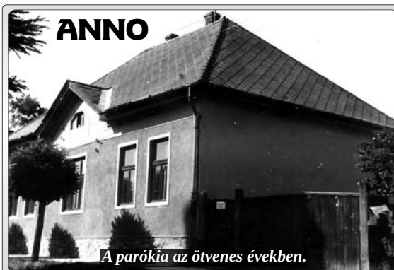
A parókia az ötvenes években.