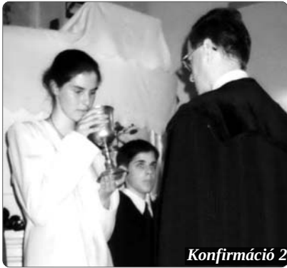
Konfirmáció 2000. május 27-én.