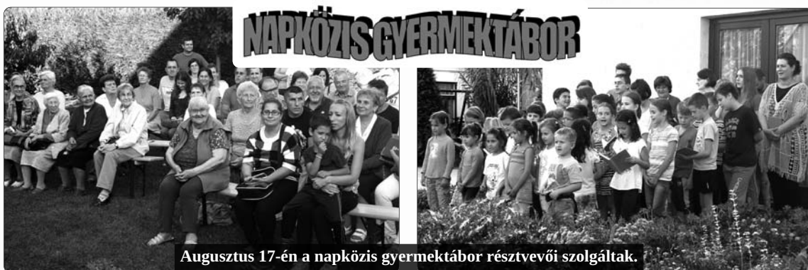
Augusztus 17-én a napközis gyermektábor résztvevői szolgáltak.