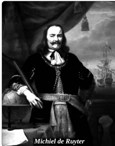
Michiel de Ruyter

A 18. században, amikor az ellenreformáció legdurvább formái már eltűnedeztek és a vallási türelem jelei felerősödtek, a módszerek is kifinomultabbak lettek. Megmutatkozott ez a katolikus szellemű bécsi udvar és a magyarországi protestáns egyházak kulturális és oktatási tevékenységében, különös tekintettel a történelemoktatásra, hiszen mindkét fél fölmérte a történelemszemlélet és a nemzettudat közötti szoros összefüggést. Vannak kutatók, akik ezzel kapcsolatban a protestáns és a katolikus felekezetek közötti, a történeti hagyományokért folytatott tudományos küzdelemről beszélnek. Okkal és