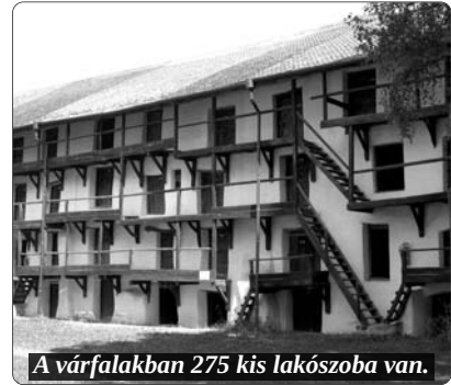
A várfalakban 275 kis lakószoba van.

De ugyanilyen szubkultúra lenne a bezárkózásból az is, hogyha farizeusok lennénk. A farizeusok pontosan ezt tették. Jól körülbástyázták a Tízparancsolatot a maguk védelme érdekében, és még hozzátettek 613-at, biztos, ami biztos. 10 + 613 – ez megment. Akkor mi a megoldás? Testvérek, a megoldást az Újszövetségben olvassuk, János evangéliuma 10. részében, amikor azt mondja Jézus, hogy „én vagyok az ajtó”. Mert nemcsak nagy és erős falakra van szükség, hanem ajtóra. Jézus elmondja, hogy mi az ajtó célja. Rögzíti azt, hogy én vagyok az, akin keresztül megtartatik az élet. Aki átme-gy az ajtón, az megtartatik – ezt mondja Jézus. Másutt így fogalmaz a mi Urunk: „Én vagyok az út, az igazság és az élet, senki sem