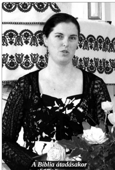
A Biblia átadásakor