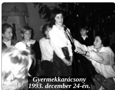
Gyermekkarácsony 1993. december 24-én.

Édesapja református, a Szabolcs-Szatmár-Bereg megyei Lónyáról származott