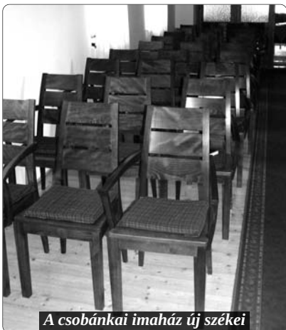
A csobánkai imaház új székei