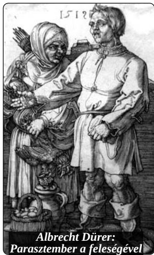
Albrecht Dürer: Parasztember a feleségével

Bakócz Tamás érsek átérzte a török veszélyt, és keresztes hadjáratot hirdetett a hazánkhoz már nagyon közel járó oszmán hadak ellen. Kapisztrán János lelkesítő prédikációinak a hatására a parasztok, akik főuraikkal ellentétben szerették és féltették hazájukat, tömegesen gyűltek zászlaja alá 1514-ben. Ezt viszont a földesurak nem nézték jó szemmel. Őket az nem izgatta, hogy a török nemsokára lesöpri a térképről Magyarországot, ők kizárólag attól félték, hogy ha jobbágyaik elmennek védeni a hazát – hogy esetleg ők is velük mehetnének, az eszükbe sem jutott –, akkor hiába küldik ki a jobbágytelkekre adószedőiket, amíg a férfiak harcolnak, addig az adószedők onnan üres kézzel térnek vissza. Úgy próbálták jobbágyaikat visszakényszeríteni, hogy otthon maradt családtagjaikat, akik a férfiak helyett is húzták az igát, kegyetlen sanyargatásokkal próbálták rávenni, hogy hívják haza a hadba vonult férfiakat. Azok, a táborban értesülve róla, hogy mi történik otthon a családjukkal, valóban haza is mentek, de a fegyvereiket is magukkal vitték, vadállati kegyetlenséggel dúlták végig a főurak birtokait, és sebzett vadként gyilkolták, akit elértek.