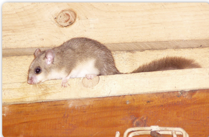
2008 – Életképek V. – Pele – Minden évben találkozunk – Van aki csodálja, van aki fél tőle...