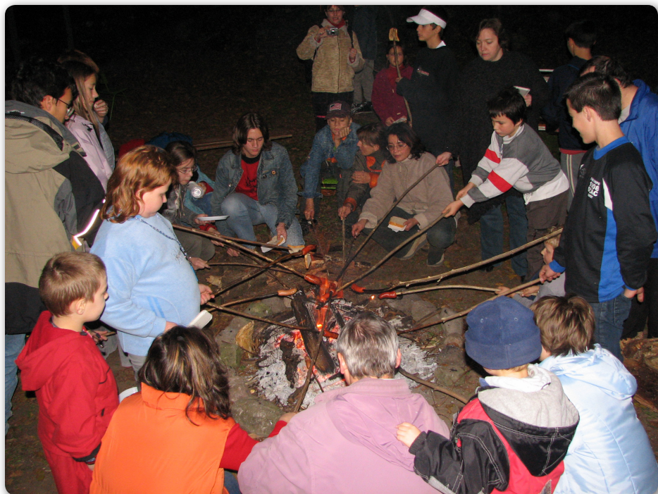
2007 – Életképek VII. – Évközbeni gyermekdélután a Forrásnál – A tűz mellett...