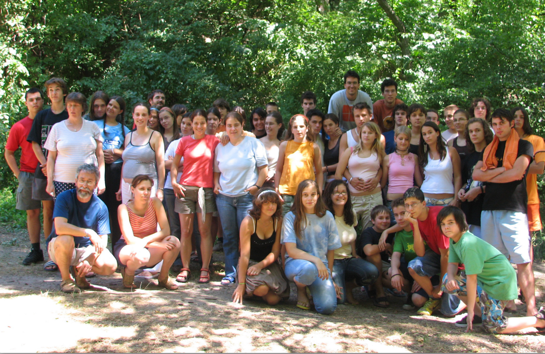
2007 – Ifi hét