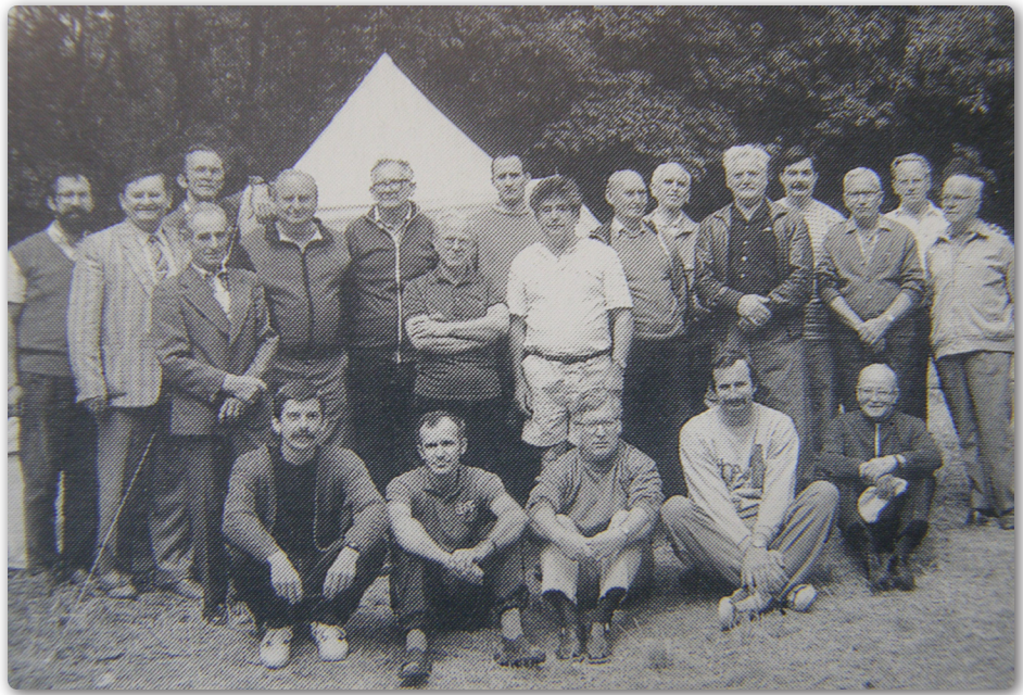
1993 – Presbiteri csendesnap családhéten, kilátogató presbiteraink