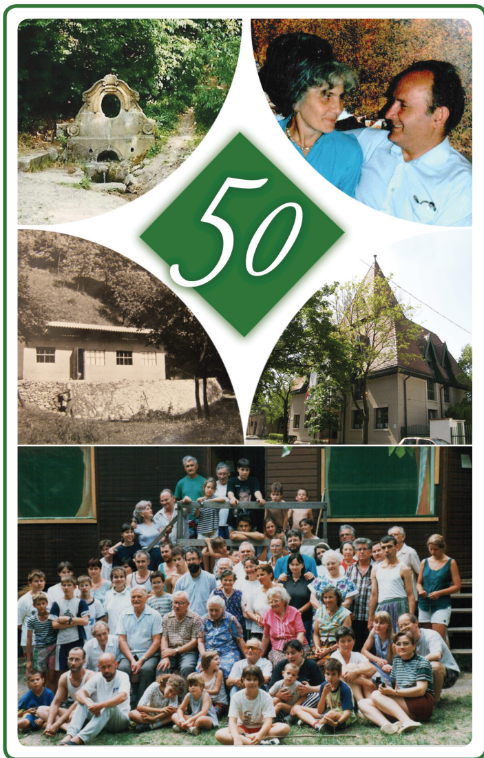
Szabadságforrás - 50 év Emlékezések, énekek, fényképek