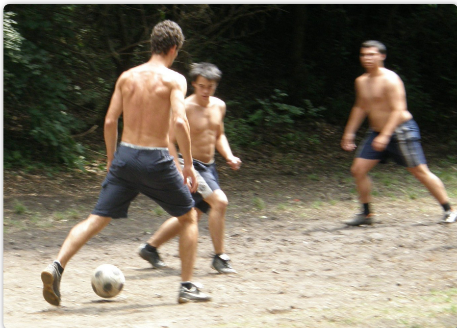
2007 – Életképek IV. – Fiúhét – Foci, minden mennyiségben, megunhatatlanul