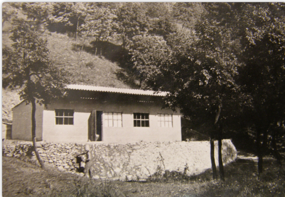
1959 – Az óriási erőfeszítés eredménye, kész a ház