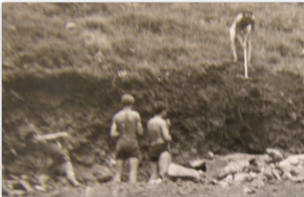
1959 – Íme, a nagy mű, alakul a teraszosítás