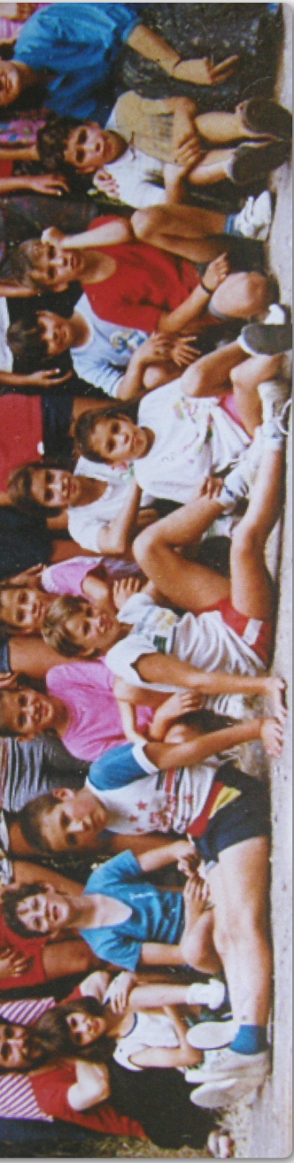
1992 – Gyermekhét, növekvő gyermekeinkkel, munkatársakkal