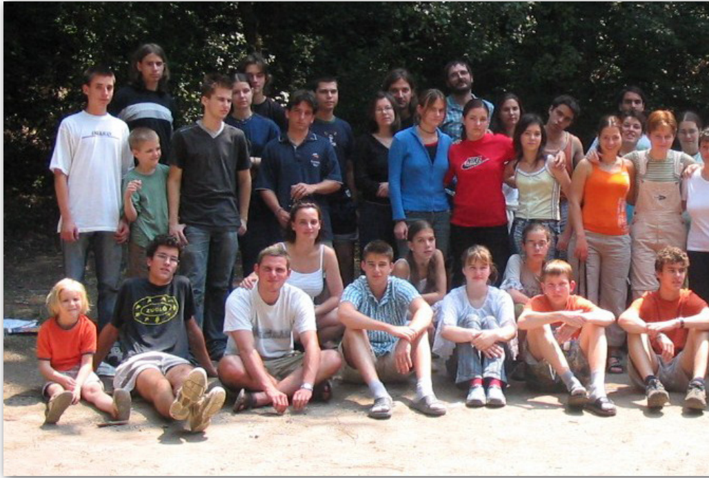
2005 – Ifi hét, lányok és fiúk együtt, kedves munkatársakkal