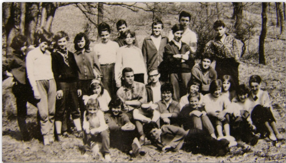
1963 – Lányok és fiúk őszi kirándulása Szabadságforrás környékén