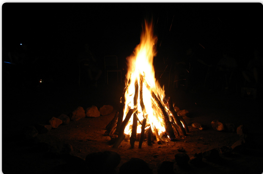
2008 – Életképek VIII. – A tűz mellett mindent jobban értünk, s mennyi-mennyi vallomás és ének...