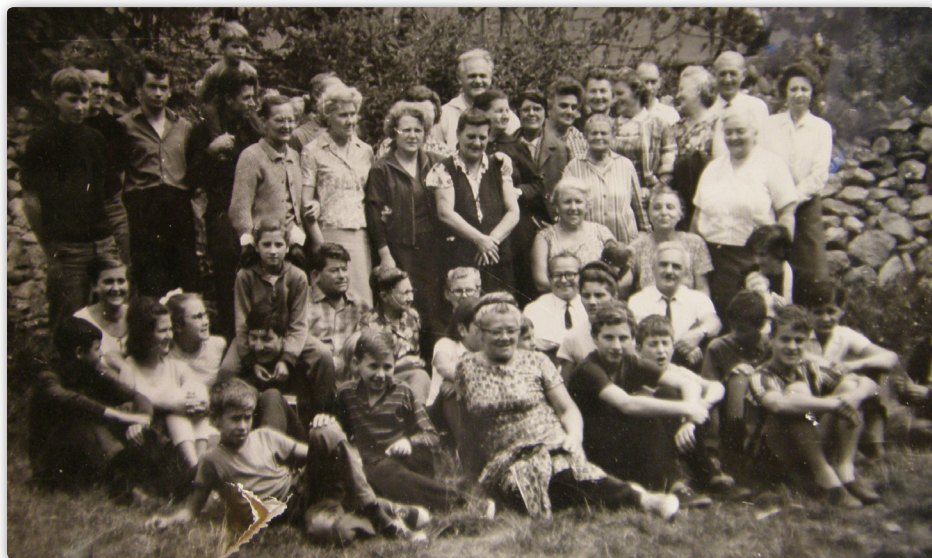
A 60-as évek közepe, családheti résztvevők