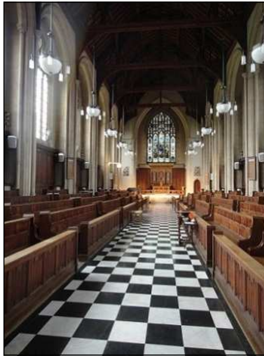
Cheltenham, egyetemi kápolna

B Zs: Az egyháztörténelem óráinkról annyi maradt meg bennem, hogy teológiájában protestáns, liturgiájában a katolikushoz közelebb álló egyházzal van szó. A valóság ma már azonban az, hogy az egyháznak van egy protestánsabb és egy katolikusabb része. Ez