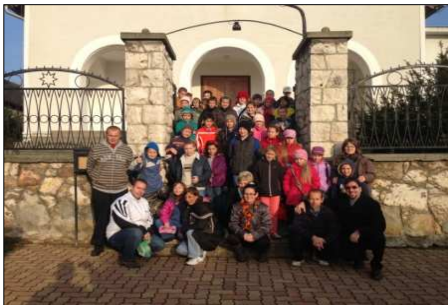
A dadi református iskola csapata

Aztán folytatódik az alkalom a „versennyel” a helyi szép modern iskolában, aminek egyébként 160 diákja van. Most hosszú, kígyózó sorban vonul a segítőkkel 300 főre duzzadt csapat a kis falu járdáin. Minden olajozottan, jól szervezeten (nem is értem, milyen bakikért kértek bocsánatot a szervezők), kétszer 5 csoportban s a versenyzők felének pedig tesztírással.