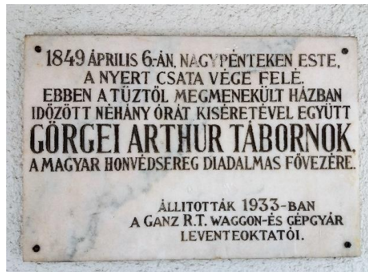
Az 1982-ben lebontott Menártovics-féle fogadó Isaszegen, melynek falára 1933. június 18-án, az országban negyedikként került elhelyezésre Görgei tábornok tiszteletére emléktábla