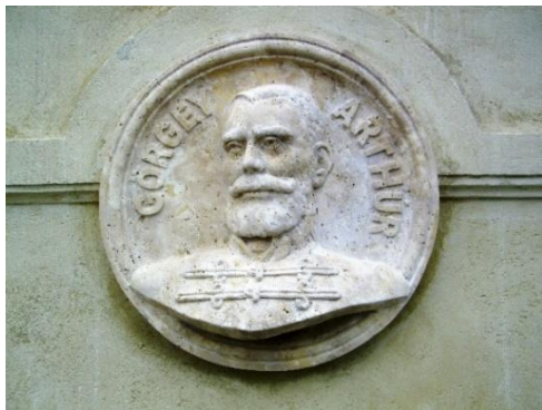
Görgey tábornok emlékére 1934. április 8-án, az országban elsőként felavatott kőből készült relief az 1901. szeptember 9-én leplezett isaszegi Honvédszobor talapzatán

Görgey Artúr elszegényedett, evangélikus vallású, ősi nemesi családban, 200 éve, 1818. január 30-án a Szepes vármegyei Toporcon született. A négy fiú között Artúr a harmadik volt. Elemi és polgári iskoláit a közeli Késmárkon, az evangélikus líceumban végezte, ahol a természettudományok keltették fel az érdeklődését és tanári pályára készült. Mivel apja az egyetemi tandíj megfizetésére nem volt képes, 1832-ben a Tullni osztrák katonai utászakadémia ingyenes képzésére íratta be. Görgey csak azért nem tiltakozott ellene, mert ott matematikát, geometriát fizikát, földmérést és térképészetet is tanulhatott. Az akadémiát osztályelsőként járta ki, ezért igazgatója javasolta is a hadnagyi előléptetését, de azt a bécsi haditanács főnemesi protekció hiányában nem hagyta jóvá.