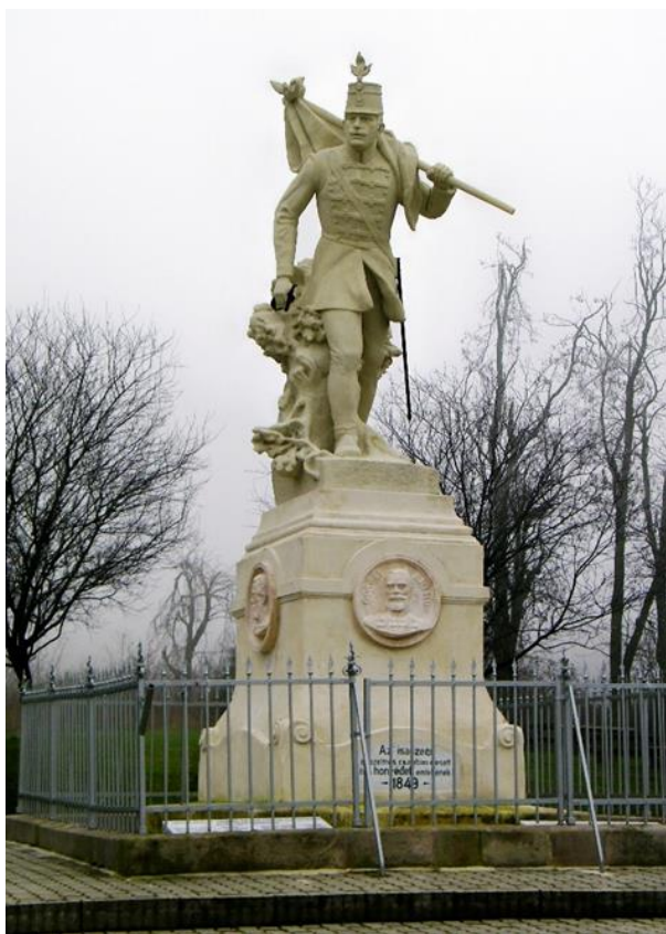
Az 1901-ben felavatott isaszegi Honvédszobor az 1934-ben ráhelyezett Görgey-relieffel

A kilátástalan helyzetben Kossuth Lajos – egyetértve a kapitulációval – Görgeyt teljhatalommal ruházta fel és a török birodalomba menekült. A fővezér, miután tisztjeit megszavaztatta, a lőszer nélkül maradt 30 ezer fős magyar seregével 1849. augusztus 13-án Világosnál tette le a fegyvert – az osztrákok legnagyobb bánatára – az országban már 200 ezer katonával rendelkező cári csapatok előtt. Kossuth szeptember 12-én, a bulgáriai Vidinben a francia és az angol követnek írt levelében – saját felelősségét mentve – áruházzal vádolta meg a korábban általa mindig támogatott Görgeyt, akit ez az igaztalan megbélyegzés élete végéig elkísért.