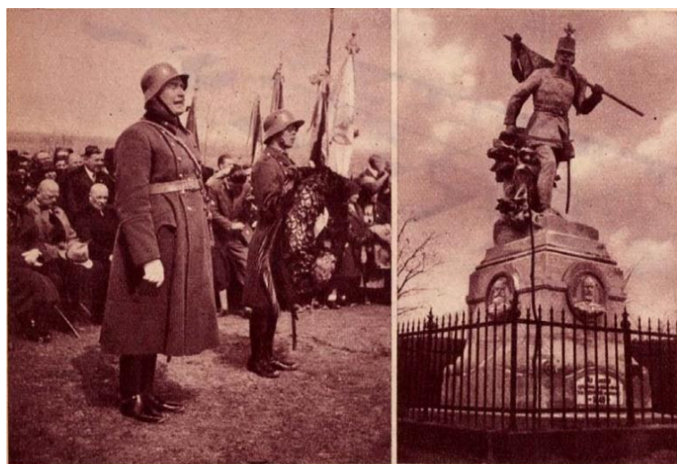
Az isaszegi csata évfordulója. Az isaszegi csata 85. évfordulóján az isaszegi honvéd szoborművön elhelyezték Görgey Artúr domborművét, amelyet fényes ünnepély keretében lepleztek le. — Baloldali kép: vitéz Gömör Árpád ezredes beszéd kíséretében koszorút helyez el az emlékművön. Jobboldali kép: Az isaszegi honvédszobor, rajta a leplezett Görgey-emlék.

Az egykori újságok megírták, hogy az isaszegi csata 85. évfordulója alkalmából rendezett dombormű-avató ünnepély zenés ébresztővel kezdődött. Dél előtt 10 órakor tábori mise volt a honvéd szobornál, amelyet Strizs József esperesplébános végzett nagy papi segédlettel. Mise alatt az egyházi énekeket a miskolci Görgey Artúr 13. honvéd gyalogezred zenekara kísérte. Az isaszegi és környékbeli dalárdák éneke után Csorna